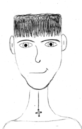
Рис. 6. Выполнен Димой К., 10 лет

Эмоциональная выразительность изображения характерна для 12% (рис.6,7,8). Из них 8% мальчики и 4% девочки.