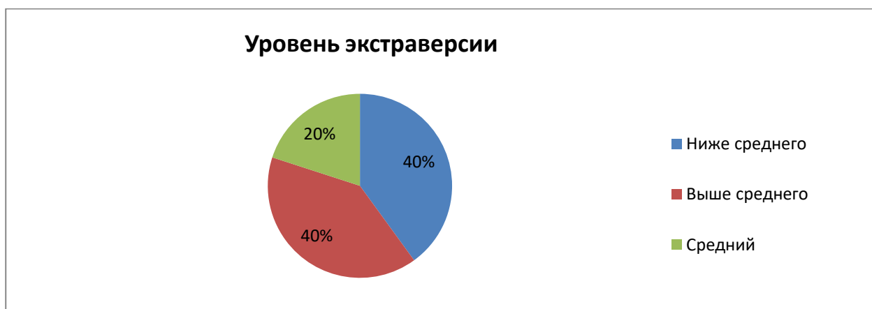
Рисунок 1. УРОВЕНЬ ЭКСТРАВЕРСИИ У ОСУЖДЕННЫХ ЮНОШЕЙ

Результаты изучения уровня экстраверсии графически представлены на рисунке 1.